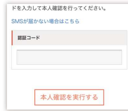
認証コードの入力