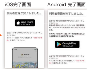
アプリのインストール